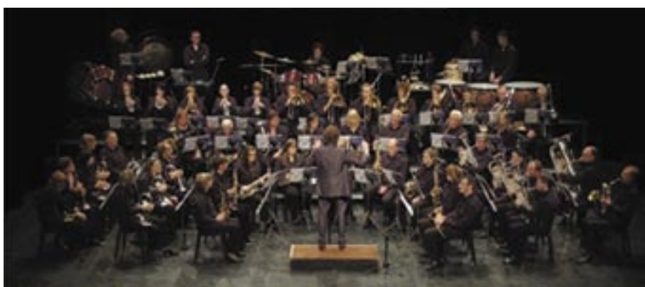
Fanfare De Vrije Belgen

☞ Optreden fanfare De Vrije Belgen om 18u30